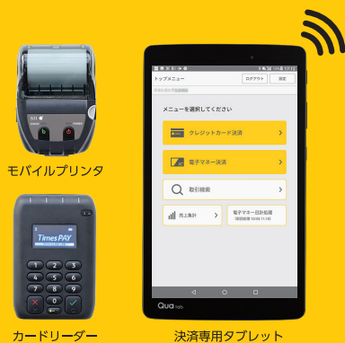
モバイルプリンタ